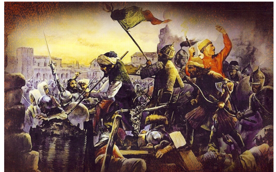
Οι Τούρκοι μπαίνουν στην Πόλη