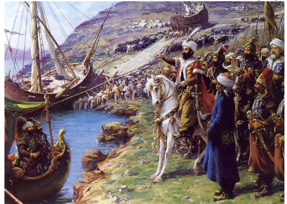
Πέρασμα τουρκικών καραβιών από το Βόσπορο στον Κεράτιο