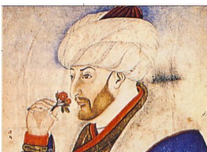
Στα βυζαντινά χρόνια - Ε' Δημοτικού / ΣΤ' Ενότητα: «Το Βυζάντιο παρακμάζει & υποκύπτει σε κατακτητές»

Ο Μωάμεθ εξοργίζεται - η πολιορκία γίνεται σκληρότερη