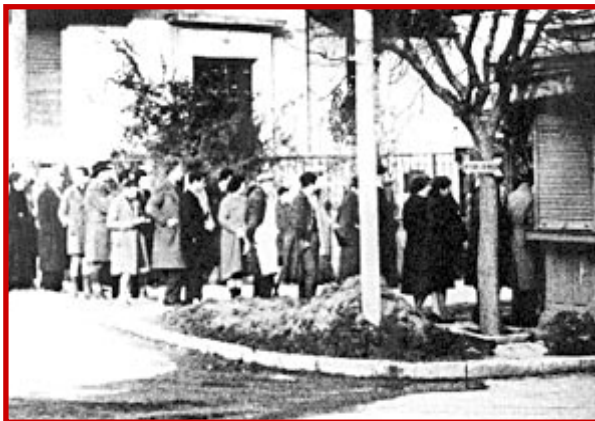
Κατοχή, Αθήνα. Ουρά για σусσίτιο.

Άλλος πολύ σημαντικός λόγος ήταν ότι οι περισσότερες μεταφορές στην Ελλάδα γίνονται από τη θάλασσα, με προορισμό τον Πειραιά και τα νησιά. Κατά τη διάρκεια όμως του πολέμου, οι Άγγλοι που ήταν αντίπαλοι των Γερμανών και των Ιταλών δεν τους επέτρεπαν να κινούνται