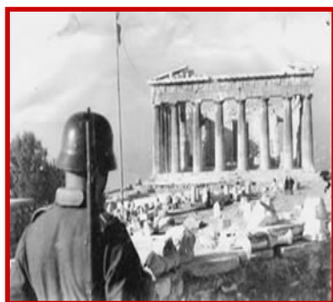
Κατοχή, Αθήνα: Οι Γερμανοί στην Ακρόπολη.

Στις 28 Οκτωβρίου 1940 η φασιστική τότε Ιταλία κήρυξε τον πόλεμο στην Ελλάδα. Μετά από αντίσταση από τη μεριά της χώρας μας που κράτησε πολλούς μήνες, την άνοιξη του 1941 της επιτέθηκε και η σύμμαχος της Ιταλίας, η ναζιστική Γερμανία. Παρά την αρχική αντίσταση της Ελλάδας τελικά ηττήθηκε και καταλήφθηκε από τους Γερμανούς, τους Ιταλούς και τους συμμάχους τους Βούλγαρους