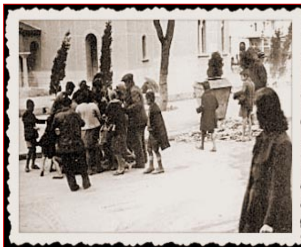
Κατοχή, Αθήνα. Περαιστικοί βοηθούν άνθρωπο που σωριάστηκε από την πείνα.

τον πρώτο χρόνο (1941-1942) πέθαναν χιλιάδες άνθρωποι. Οι κατακτητές άρπαξαν από τη χώρα ό,τι τους ήταν χρήσιμο για τον πόλεμο που συνέχιζαν με άλλες χώρες (Β' Παγκόσμιος Πόλεμος): τρόφιμα, πρώτες ύλες από τα εργοστάσια, μεταφορικά μέσα και καύσιμα, χρήματα. Η ναζιστική ιδεολογία των Γερμανών στηριζόταν στο ρατσισμό, θεωρούσε δηλαδή τους άλλους λαούς κατώτερους από